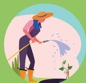
RIEGO JARDINES PRIVADOS REG JARDINS PRIVATS