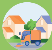
LIMPIEZA DE CALLES NETEJA DE CARRERS