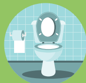
AGUA CISTERNAS WC AIGUA CISTERNES WC