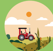
RIEGO AGRÍCOLA REG AGRÍCOLA