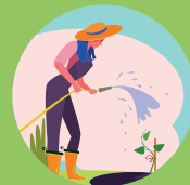
RIEGO JARDINES PRIVADOS REG JARDINS PRIVATS