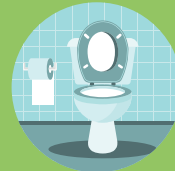
AGUA CISTERNAS WC AIGUA CISTERNES WC