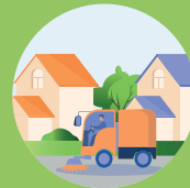
LIMPIEZA DE CALLES NETEJA DE CARRERS